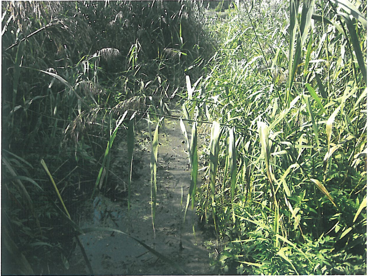
Fot. Miejsce wykorzystywane jako slip.

Lokalizację określono następującymi współrzędnymi: X: 655615,629; Y:512534,401