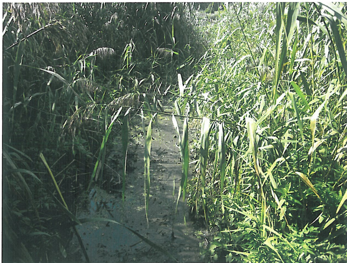
Fot. Miejsce wykorzystywane jako slip.