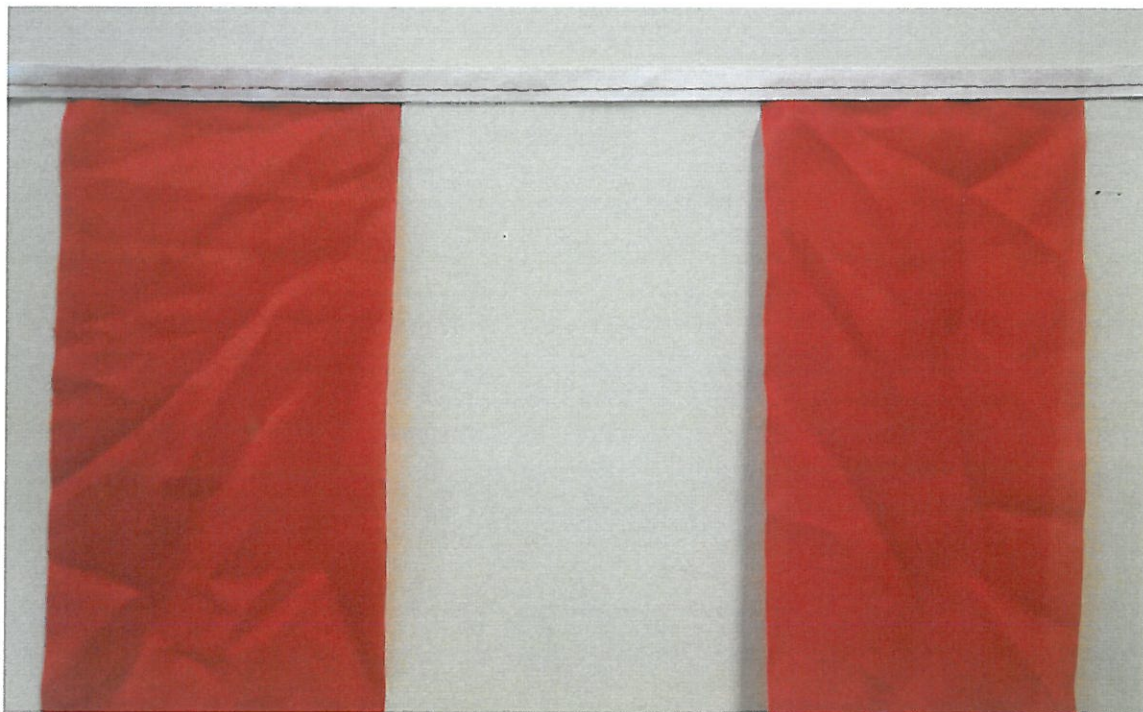
Przykład wykonania fladr na taśmie