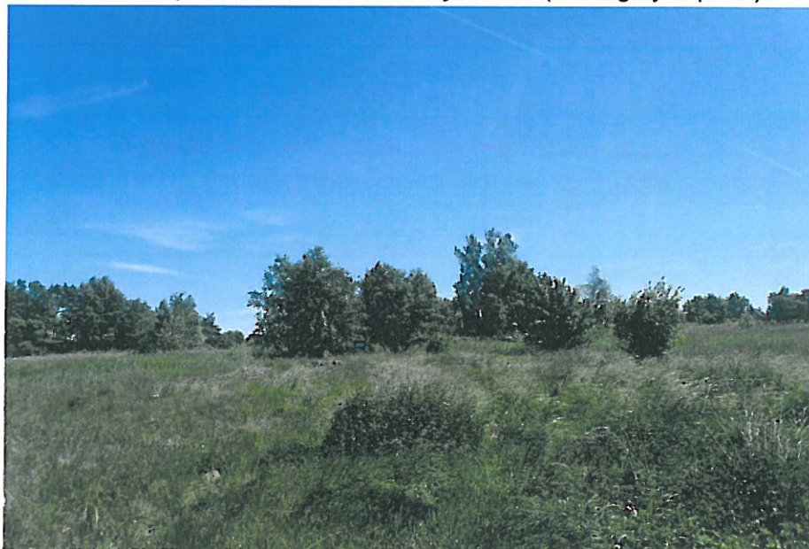
Miejsce składowania biomasy z powierzchni 3 i 24