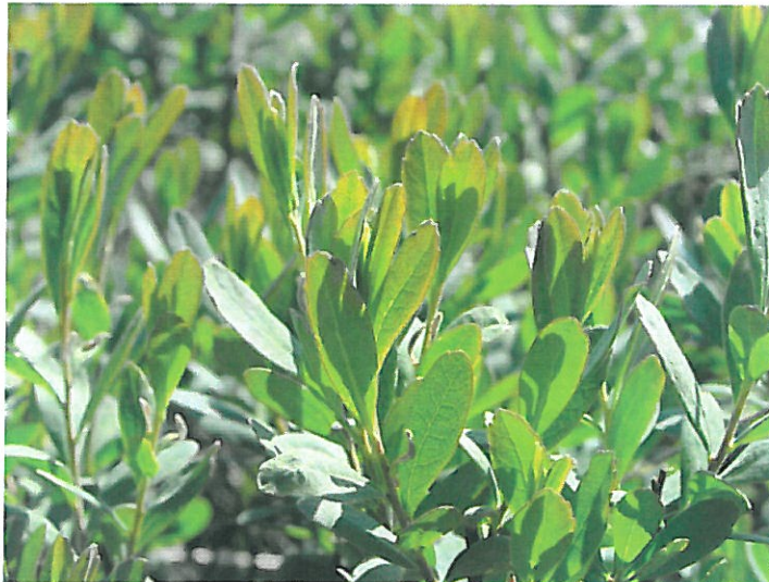
Woskownica europejska Myrica gale